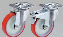
Ruote - Wheels