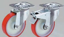
Ruote - Wheels